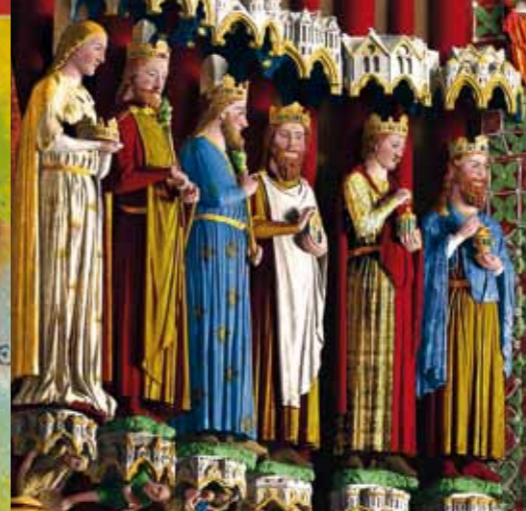
Amiens, la cathédrale en couleurs illumine les nuits amiénoises depuis décembre 1999. Création Skertzò pour Amiens Métropole