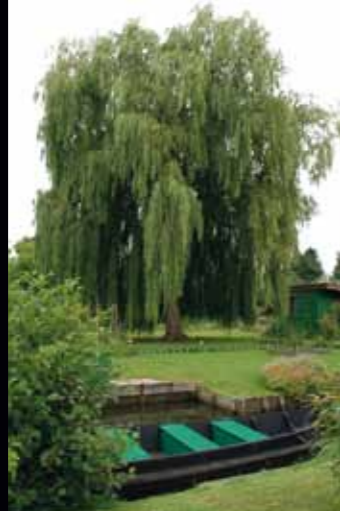
Les hortillonnages, surprenants îlots, invitent les promeneurs à la découverte de la faune et la flore.