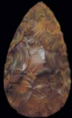
Silex taillé en biface datant de l'époque acheuléenne -350 000 / -400 000.

concourt à la formation de jeunes artistes. Côté Sports, le stade de la Licorne, conçu en 1999 par le cabinet Chaix et Morel assisté du cabinet Richard présente une architecture résolument innovante alliant charpente métallique et couverture de verre. A cet ancrage dans la modernité répond depuis la même année, la restitution des polychromies des portails de la cathédrale Notre-Dame, dont la façade retrouve ainsi, au cours d'un spectacle la nuit venue, son éclat médiéval.