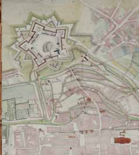
La citadelle d'Errard de Bar-le-duc, détail d'un plan pour les travaux de défense en 1815.