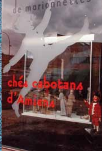
Le Théâtre Chés Cabotans perpétue la tradition d'un théâtre populaire et contribue à la défense de la langue picarde.