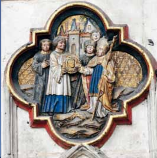
La remise à l'évêque de la précieuse relique du chef de saint Jean-Baptiste par Wallon de Sarton figure dans un quadrilobe de la cathédrale.