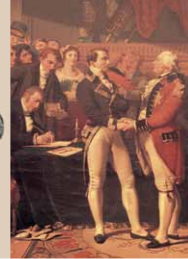
La Paix d'Amiens de C.J. Ziegler, détail, Hôtel de ville, salle du Congrès.