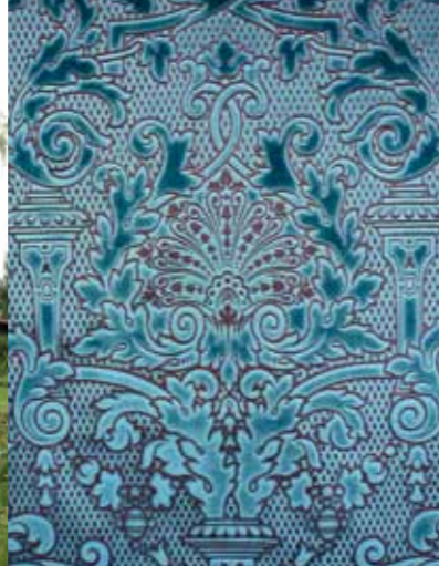
La teinture bleue et le gaufrage du velours dominent les grandes traditions industrielles amiénoises.