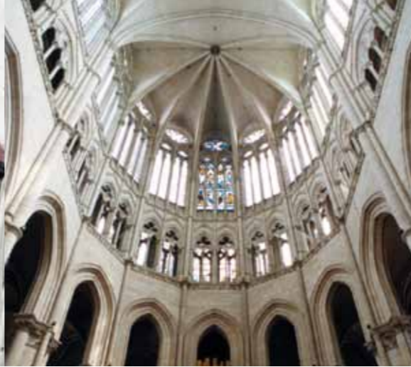
Dans le chœur de Notre-Dame, la lumière triomphe et célèbre la naissance de l'art gothique rayonnant.