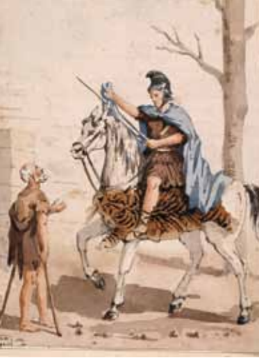
Saint Martin, alors simple légionnaire romain, partage son manteau avec un pauvre aux portes d'Amiens. Bibliothèques d'Amiens (Ms 1360 E p. 013)

Amiens est occupée quelques jours en 1914 puis devient une ville de l'Arrière. En 1916, l'effroyable bataille de la Somme se déroule à quelques trente kilomètres d'une ville de plus en plus bombardée. La reconstruction n'atteint certes pas la même ampleur qu'à Saint-Quentin mais favorise l'éclosion de l'Art déco dans la ville. Après le grand incendie de 1940, la reconstruction générale du centre ville est confiée à Pierre Dufau. Il fait appel, entre autres, à Auguste Perret qui réalise sa fameuse tour et l'ensemble de la gare.