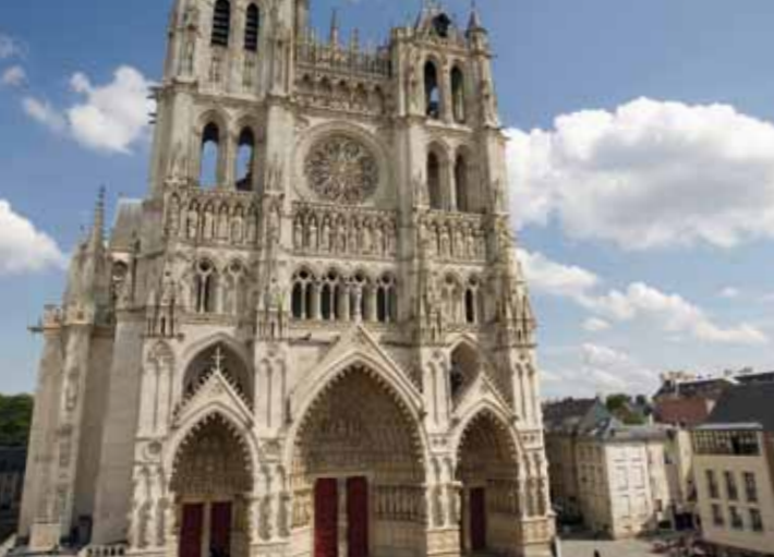
Elevée sur la dernière terrasse alluviale de la Somme, la cathédrale présente aujourd'hui un environnement propice à de nouveaux aménagements urbains.

De l'autre côté du boulevard, le Cirque, salle de spectacle de 3500 places à l'origine, à l'ambitieuse charpente métallique, fut inauguré par Jules Verne en 1889. En 2003, dans le cadre d'une commande publique, l'artiste autrichien Ernst Caramelle a tracé sur la coupole une étoile qui rappelle la toile colorée des chapiteaux itinérants.