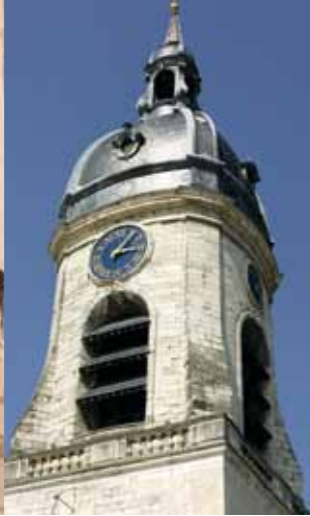
La tour du beffroi, plusieurs fois reconstruite, présente encore aujourd'hui une base du XV e et un campanile du XVIII e siècle.