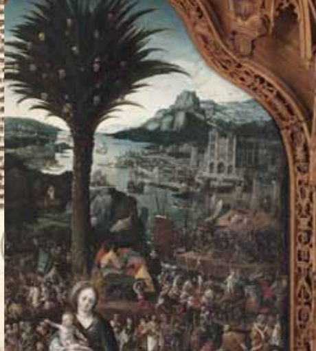
La cathédrale, l'église Saint-Firmin le Confesseur, les remparts d'Amiens, détail de la Vierge au palmier, 1520. Musée de Picardie