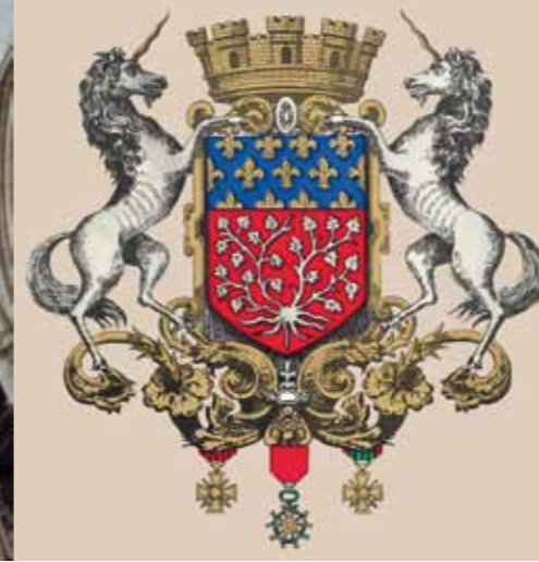
Sur les armes de la ville, le lierre remplace aujourd'hui l'osier, symbole de l'attachement de la commune aux lys de France.