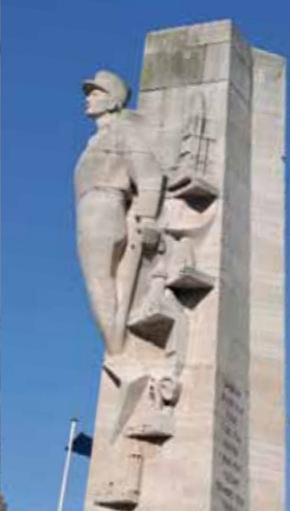
Place René Goblet, la statue du général Leclerc est l'œuvre des frères Martel.