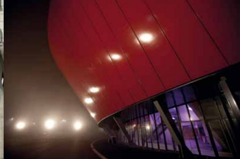
A proximité de la nouvelle pénétrante ouest de la ville, Le Zénith, créé par l'architecte Massimiliano Fuksas, s'adosse au Stade de La Licorne, dessiné par l'agence Chaix et Morel.