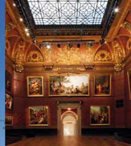
Parmi les réalisations d'Émile Ricquier figure l'ancienne cour intérieure du Musée de Picardie que l'architecte a pour mission de couvrir et de transformer en grand salon.