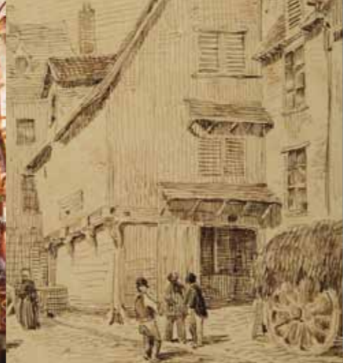
En 1528, propriété du chapitre, le moulin Passe-Avant sert à moudre le blé. Musée de Picardie (MP Duthoit VIII-21)