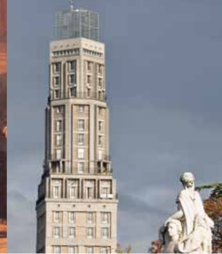
La tour Perret, réalisation expérimentale inaugurée en 1952, est aujourd'hui coiffée d'un sablier de verre actif. Réalisé en 2005 par T.Van de Wyngaert, il est le prologue du nouvel aménagement urbain de la place A. Fiquet confié à Claude Vasconi.