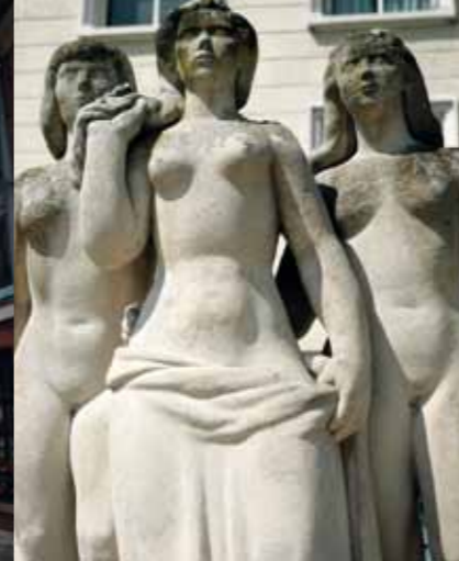
La Renaissance d'Amiens, groupe sculpté par Emile Morlaix, vient enrichir les façades des I.S.A.I. (Immeubles Sans Affectation Immédiate) construits entre 1947 et 1951.