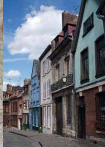
La rue Metz-l'Evêque, au chevet de la cathédrale, possède les demeures les plus anciennes de la ville.