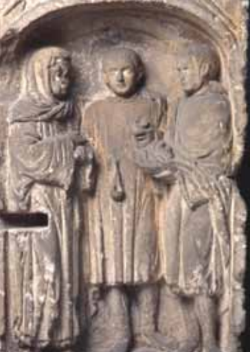
Stèle funéraire à trois personnages, II e siècle après JC. Musée de Picardie (MP 88 396)

périphérie : le Pigeonnier et Etouvie. Aujourd'hui, la Communauté d'agglomération Amiens Métropole rassemble trente-trois communes pour une population de 180 000 habitants. Le projet urbain achève la reconstruction d'Amiens tout en mettant en valeur les singularités de la ville et de son histoire. Si la production architecturale y cultive parfois le goût du pittoresque, elle sait aussi séduire ou provoquer la polémique.