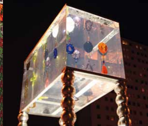
En 2007, Jean-Michel Othoniel présente Les larmes de couleurs, vision allégorique du poème Voyelles d'Arthur Rimbaud, devant le collège qui porte son nom dans le quartier Amiens Nord. Sept symboles en verre soufflé, semblables à des gouttes d'eau en suspension, font référence à une couleur inspirée du poème.