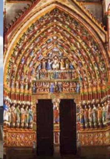
Amiens, la cathédrale en couleurs, le portail du Sauveur. Création Skertzó pour Amiens Métropole.