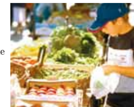
La rue Metz-l'Evêque